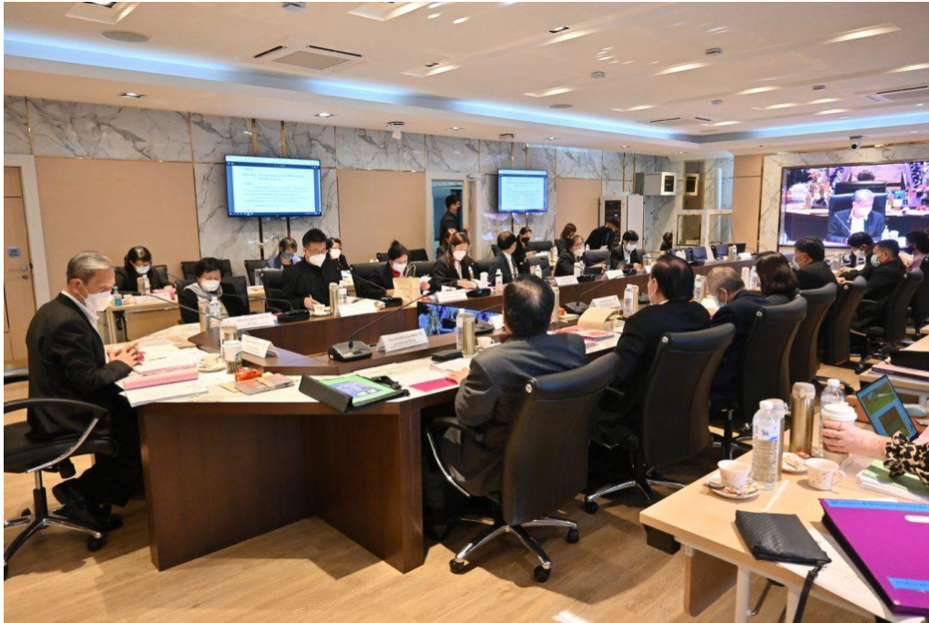
ภาพ 1 การประชุมสภามหาวิทยาลัยนเรศวร ในการประชุม ครั้งที่ 293 (1/2565) วันเสาร์ที่ 29 มกราคม 2565 ณ ห้องประชุมพลโทพระยาศลีธานินเทศ อาคาร วช. 2 ชั้น 3 สำนักงานการวิจัยแห่งชาติ (วช.)