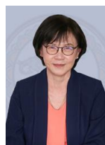
รศ. ดร.ศรินทร์ทิพย์ แทนธานี รักษาราชการแทนอธิการบดี มหาวิทยาลัยนเรศวร