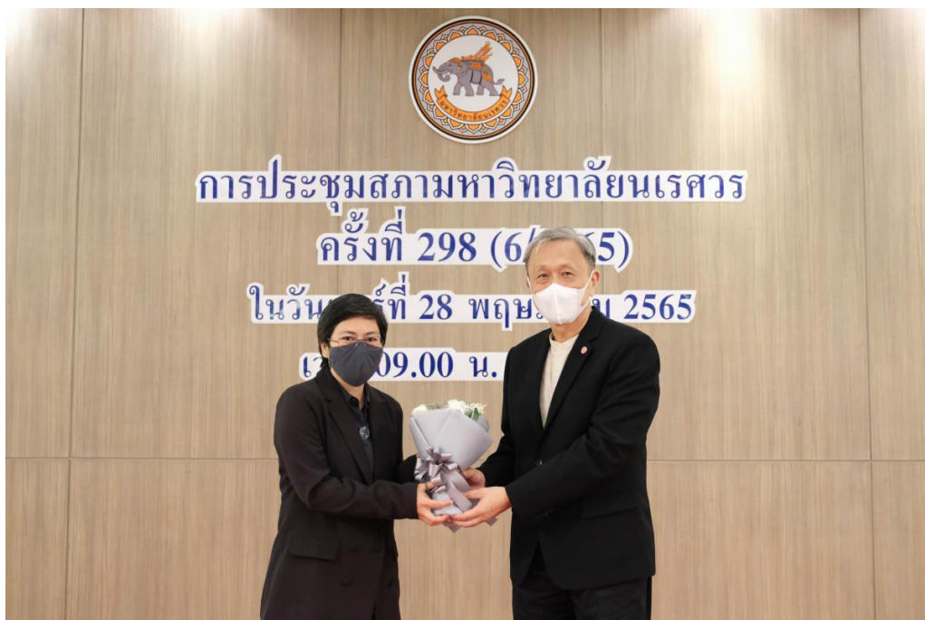
ภาพ 6 การประชุมสภามหาวิทยาลัยนเรศวร ในการประชุม ครั้งที่ 298 (6/2565) ในวันเสาร์ที่ 28 พฤษภาคม 2565 ห้องประชุมทิวลิป ชั้น 1 โรงแรมรามาคาร์ดินัส ถนนวิภาวดีรังสิต กรุงเทพฯ และประชุมผ่านสื่ออิเล็กทรอนิกส์