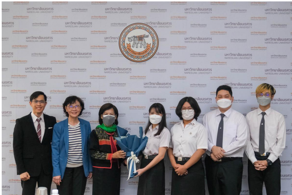
ภาพ 13 การประชุมสภามหาวิทยาลัยนเรศวร ในการประชุม ครั้งที่ 305 (13/2565) ในวันเสาร์ที่ 24 ธันวาคม 2565 ณ ห้องประชุมสุพรรณกัลยา 3 อาคารสำนักงานอธิการบดี ชั้น 3 มหาวิทยาลัยนเรศวร และประชุมผ่านสื่ออิเล็กทรอนิกส์

ในวันเสาร์ที่ 26 พฤศจิกายน 2565 ห้องประชุมสุพรรณกัลยา 3 อาคารสำนักงานอธิการบดี ชั้น 3 มหาวิทยาลัยนเรศวร และประชุมผ่านสื่ออิเล็กทรอนิกส์