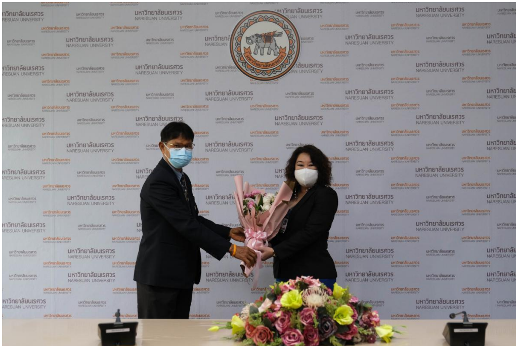
ภาพ 5 การประชุมสภามหาวิทยาลัยนเรศวร ในการประชุม ครั้งที่ 297 (5/2565) ในวันเสาร์ที่ 30 เมษายน 2565 ณ ห้องประชุมสุพรรณกัลยา 3 อาคารสำนักงานอธิการบดี ชั้น 3 มหาวิทยาลัยนเรศวร และประชุมผ่านสื่ออิเล็กทรอนิกส์