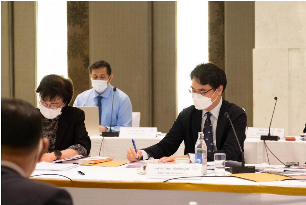
ภาพ 7 การประชุมสภามหาวิทยาลัยนเรศวร ในการประชุม ครั้งที่ 299 (7/2565) ในวันเสาร์ที่ 25 มิถุนายน 2565 ห้องประชุมทิวลิป ชั้น 1 โรงแรมรามาคาร์เด็นส์ ถนนวิภาวดีรังสิต กรุงเทพฯ และประชุมผ่านสื่ออิเล็กทรอนิกส์