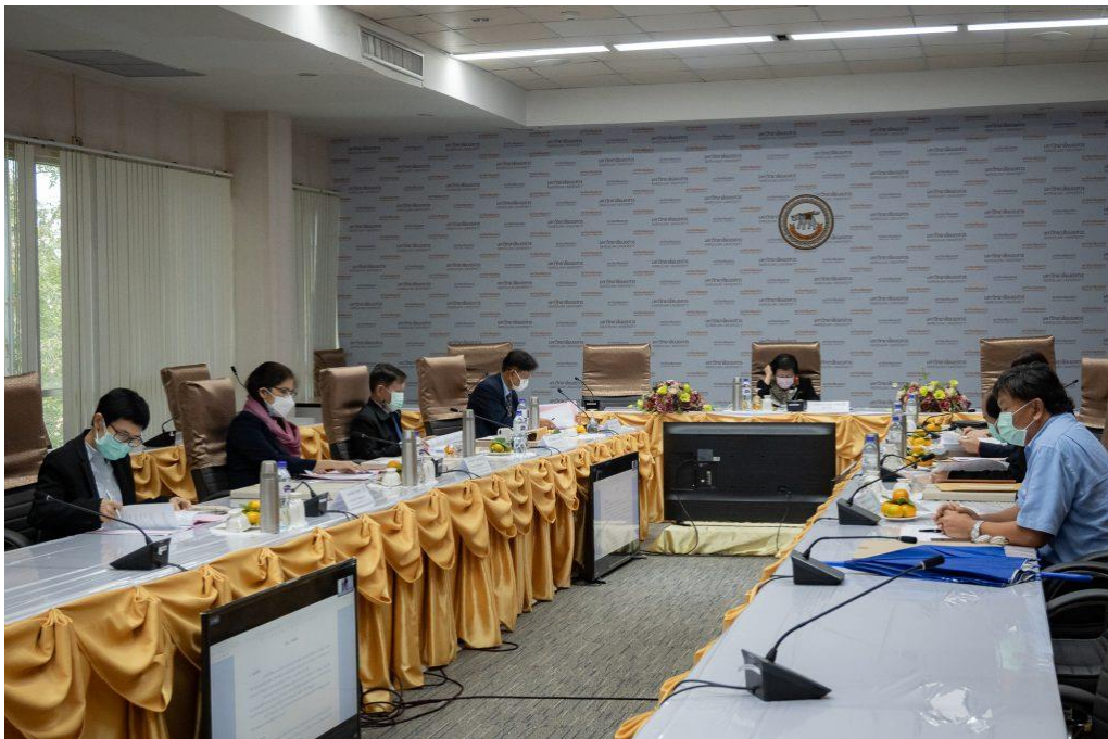
ภาพ 2 การประชุมสภามหาวิทยาลัยนเรศวร ในการประชุม ครั้งที่ 294 (2/2565) ในวันอังคารที่ 15 กุมภาพันธ์ 2565 ณ ห้องประชุมสุพรรณกัลยา 3 อาคารสำนักงานอธิการบดี ชั้น 3 มหาวิทยาลัยนเรศวร และประชุมผ่านสื่ออิเล็กทรอนิกส์