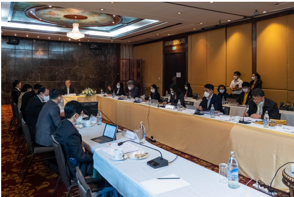
ภาพ 12 การประชุมสภามหาวิทยาลัยนเรศวร ในการประชุม ครั้งที่ 304 (12/2565)