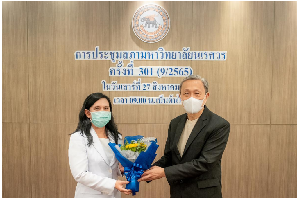
ภาพ 9 การประชุมสภามหาวิทยาลัยนเรศวร ในการประชุม ครั้งที่ 301 (9/2565) ในวันเสาร์ที่ 27 สิงหาคม 2565 ณ ห้องประชุมสุพรรณกัลยา 3 อาคารสำนักงานอธิการบดี ชั้น 3 มหาวิทยาลัยนเรศวร และประชุมผ่านสื่ออิเล็กทรอนิกส์