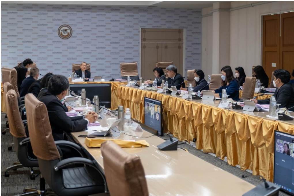
ภาพ 11 การประชุมสภามหาวิทยาลัยนเรศวร ในการประชุม ครั้งที่ 303 (11/2565) ในวันเสาร์ที่ 29 ตุลาคม 2565 ณ ห้องประชุมสุพรรณกัลยา 3 อาคารสำนักงานอธิการบดี ชั้น 3 มหาวิทยาลัยนเรศวร และประชุมผ่านสื่ออิเล็กทรอนิกส์