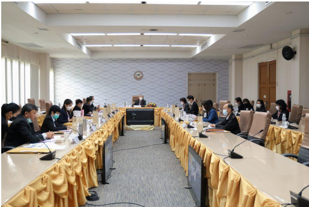
ภาพ 8 การประชุมสภามหาวิทยาลัยนเรศวร ในการประชุม ครั้งที่ 300 (8/2565) ในวันอาทิตย์ที่ 24 กรกฎาคม 2565 ณ ห้องประชุมสุพรรณกัลยา 3 อาคารสำนักงานอธิการบดี ชั้น 3 มหาวิทยาลัยนเรศวร และประชุมผ่านสื่ออิเล็กทรอนิกส์