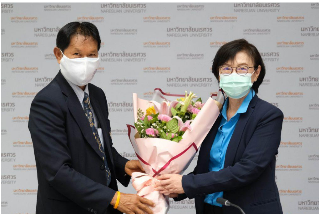
ภาพ 4 การประชุมสภามหาวิทยาลัยนเรศวร ในการประชุม ครั้งที่ 296 (4/2565) ในวันเสาร์ที่ 26 มีนาคม 2565 ณ ห้องประชุมสุพรรณกัลยา 3 อาคารสำนักงานอธิการบดี ชั้น 3 มหาวิทยาลัยนเรศวร และประชุมผ่านสื่ออิเล็กทรอนิกส์