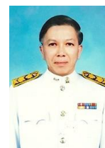
ศ. กิตติคุณ ดร.สุรชาติ บำรุงสุข