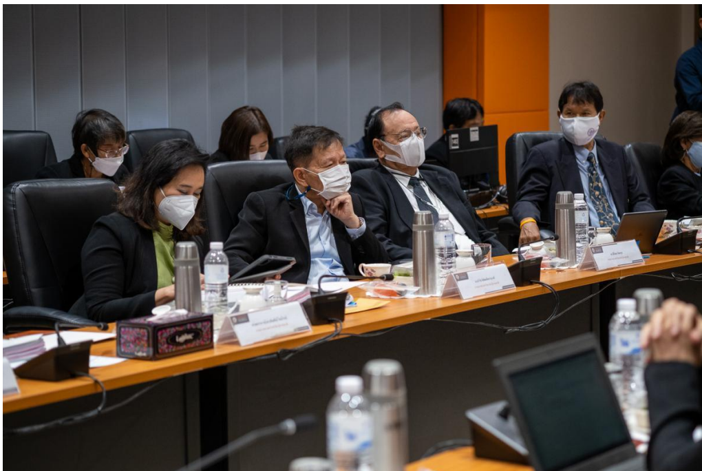
ภาพที่ 14 – 21

การประชุมสภามหาวิทยาลัยวาระพิเศษ (Retreat) ในระหว่างวันที่ 20 – 21 สิงหาคม 2565 ณ ห้องประชุมเทาแสด อาคารอุทยานองค์สมเด็จพระนเรศวรมหาราช มหาวิทยาลัยนเรศวร และประชุมผ่านสื่ออิเล็กทรอนิกส์