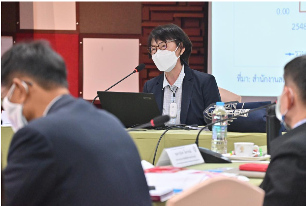
ภาพ 3 การประชุมสภามหาวิทยาลัยนเรศวร ในการประชุม ครั้งที่ 295 (3/2565) ในวันเสาร์ที่ 26 กุมภาพันธ์ 2565 ห้องประชุมจอมพลสฤษดิ์ธนะรัชต์ อาคาร วช. 1 สำนักงานการวิจัยแห่งชาติ (วช.) กรุงเทพมหานคร