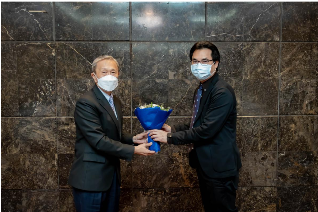
ภาพ 10 การประชุมสภามหาวิทยาลัยนเรศวร ในการประชุม ครั้งที่ 302 (10/2565) ในวันเสาร์ที่ 17 กันยายน 2565 ณ ห้องประชุมลีลาวดี ชั้น 1 โรงแรมรามารการ์เด็นส์ ถนนวิภาวดีรังสิต กรุงเทพฯ และประชุมผ่านสื่ออิเล็กทรอนิกส์